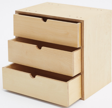
Szafka posiadająca pion z trzema szufladami.